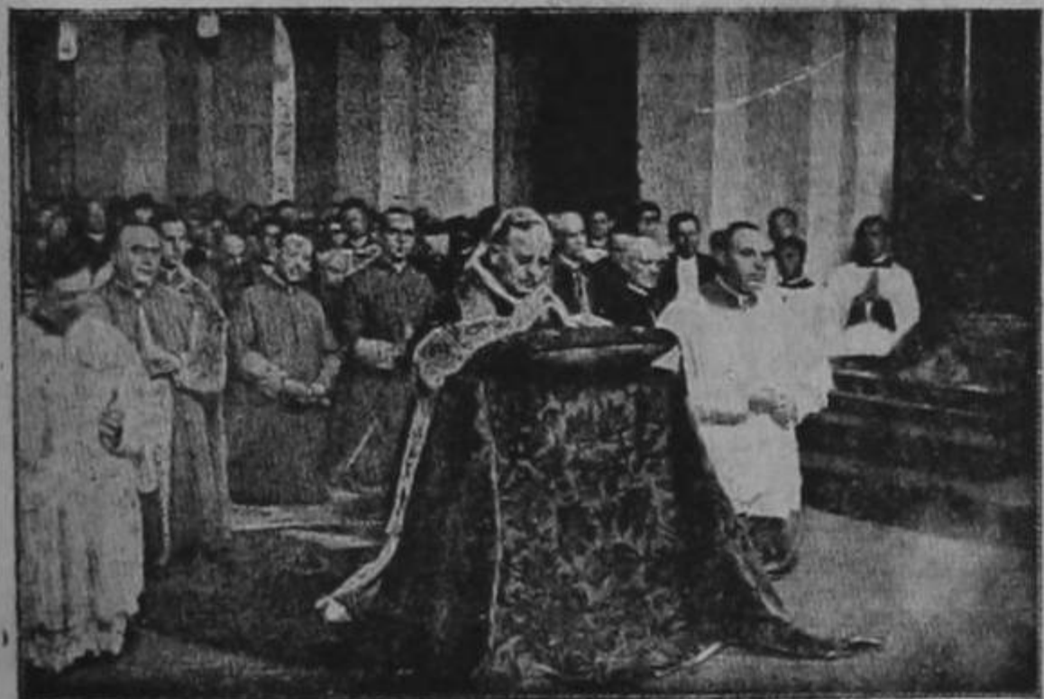
Su Santidad el Papa Pío XI en oración en la Iglesia del Colegio de la "Propaganda de la Fe". Esta Iglesia fue consagrada el 19 de abril de 1931, por su eminencia el Cardenal Van Rossum, Prefecto de la Sagrada Congregación de la Propaganda Fide

Un momento de verdadera contrición borra las deudas de muchos años empleados en ofender a Dios. Por enormes que sean los pecados los perdona el Señor al que reconoce su culpa y se acoge a su misericordia. Pero Dios no olvidará los agravios que le hemos hecho si no perdonamos a nuestros enemigos. Por eso decimos en la oración del Padre Nuestro : «Perdónanos nuestras deudas así como nosotros perdonamos a nuestros deudores.» Con la medida que les midiéremos seremos medidos! ¡Cuán poco es lo que nos han agraviado nuestros enemigos en comparación de lo mucho que nosotros hemos ofendido a Dios!