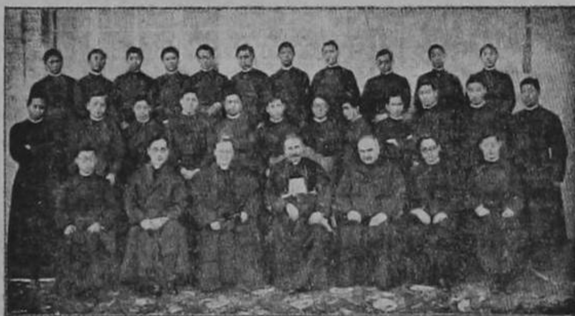
Seminaristas chinos que estudian en el Colegio de la "Propaganda de la Fe", para ir a convertir a sus hermanos